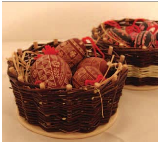
Pirhi / Slavica Veselič, KP Kolpa, Adlešiči