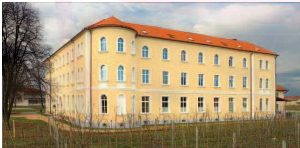
Zavod Marianum Veržej