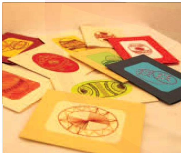
‘Voščilnice / ‘VDC ‘Nova Gorica, enota Solkan