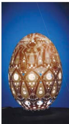
‘Vrhniški pih / ‘Franc Grom

Gimnazija Jurija Vege Idrija, Čipkarska šola Idrija in Maja Svetlik, Idrija