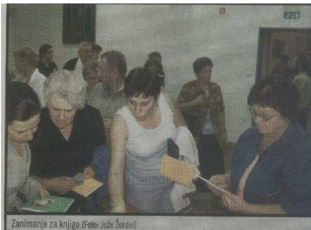
Zanimanje za knjigo