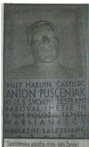
Spominska plošča